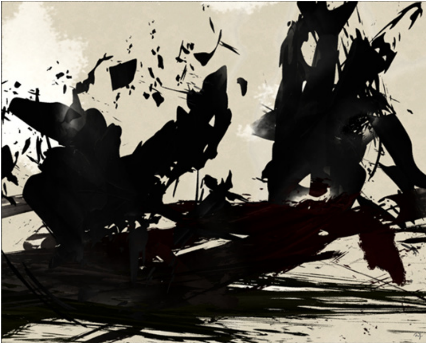
darkmats 250149 2011 Acryl, VOC auf Leinwand 200 x 250 cm