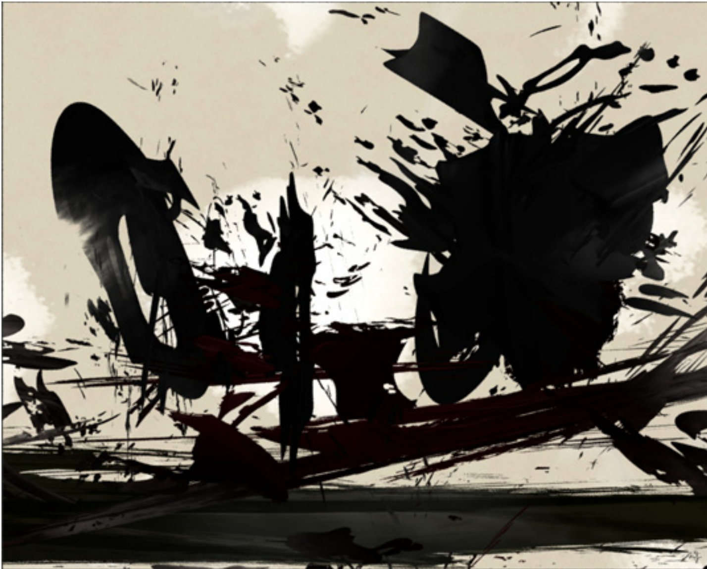
darkmats 250227 2011 Acryl, VOC auf Leinwand 200 x 250 cm