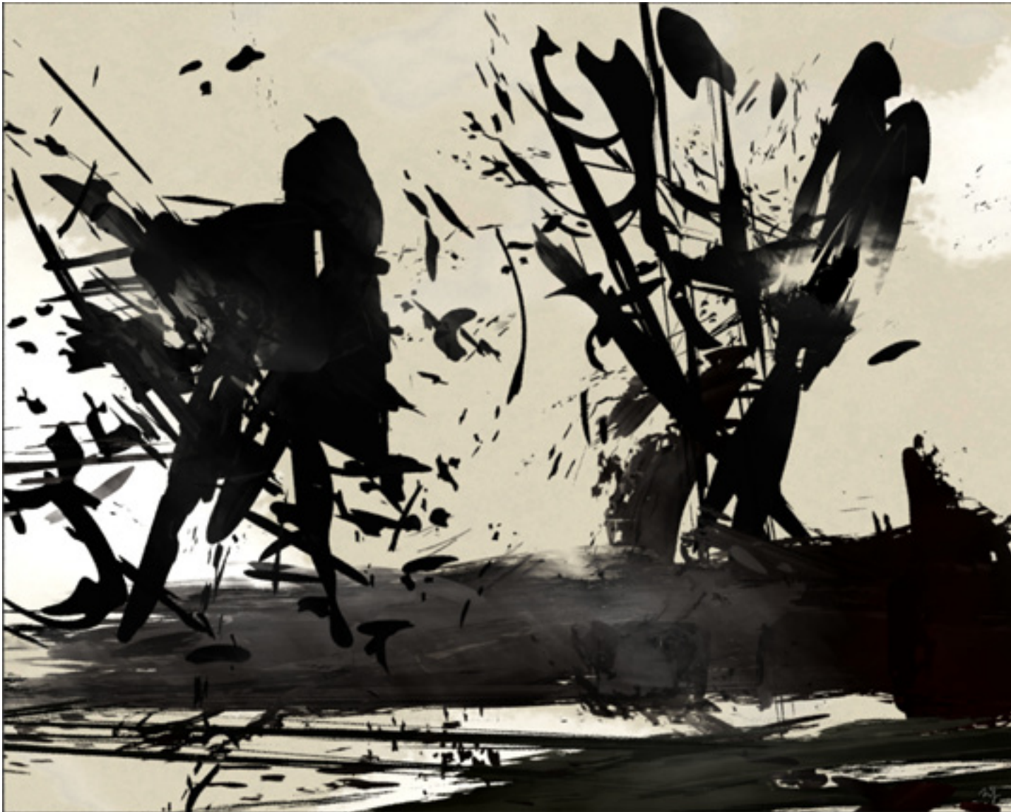
darkmats 250667 2011 Acryl, VOC auf Leinwand 200 x 250 cm