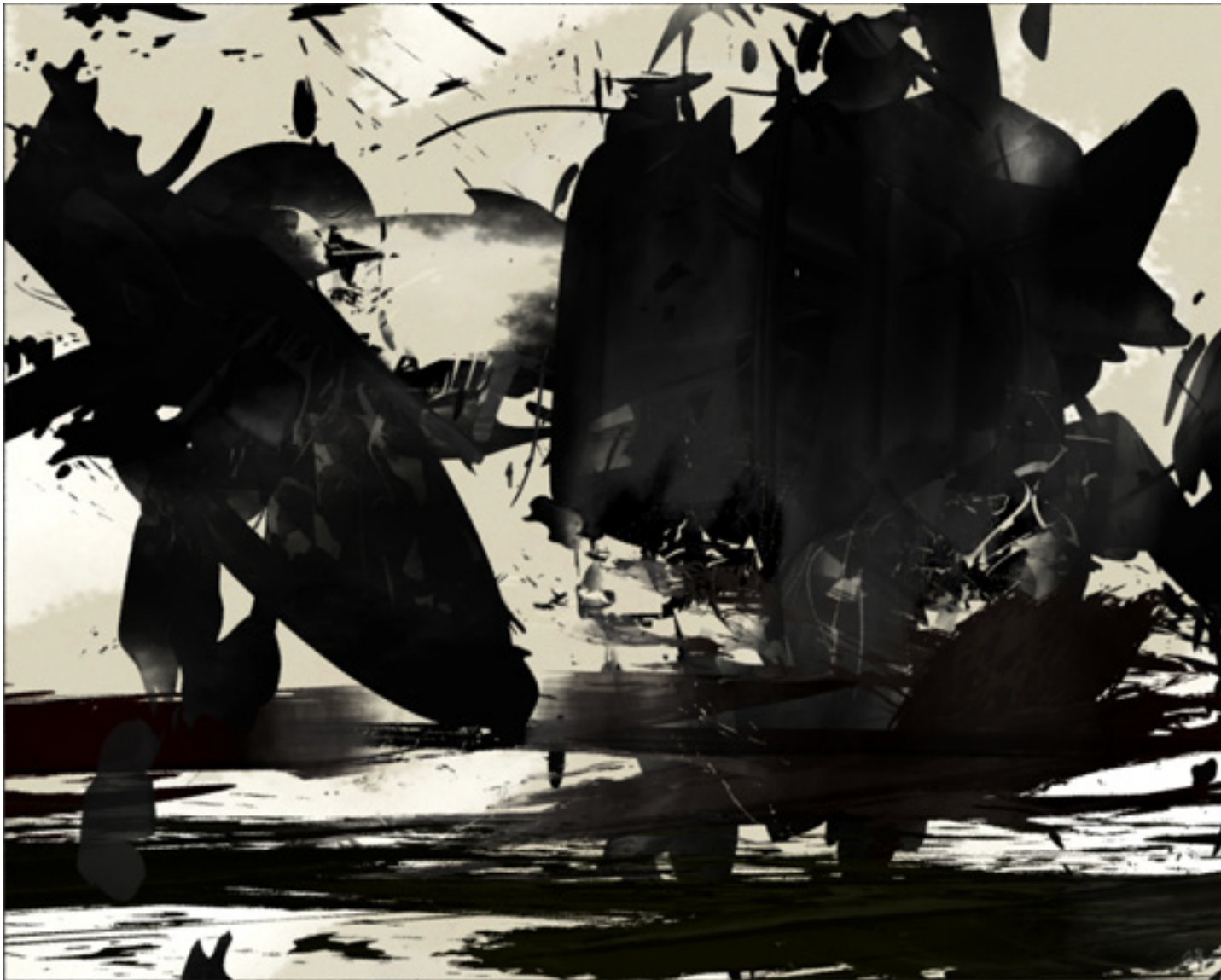
darkmats 250428 2011 Acryl, VOC auf Leinwand 200 x 250 cm