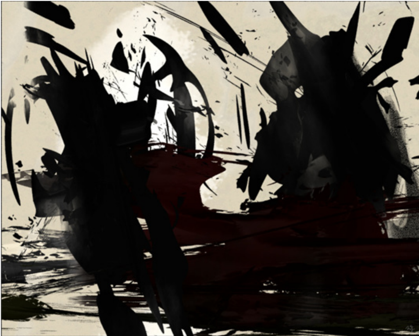
darkmats 250565 2011 Acryl, VOC auf Leinwand 200 x 250 cm