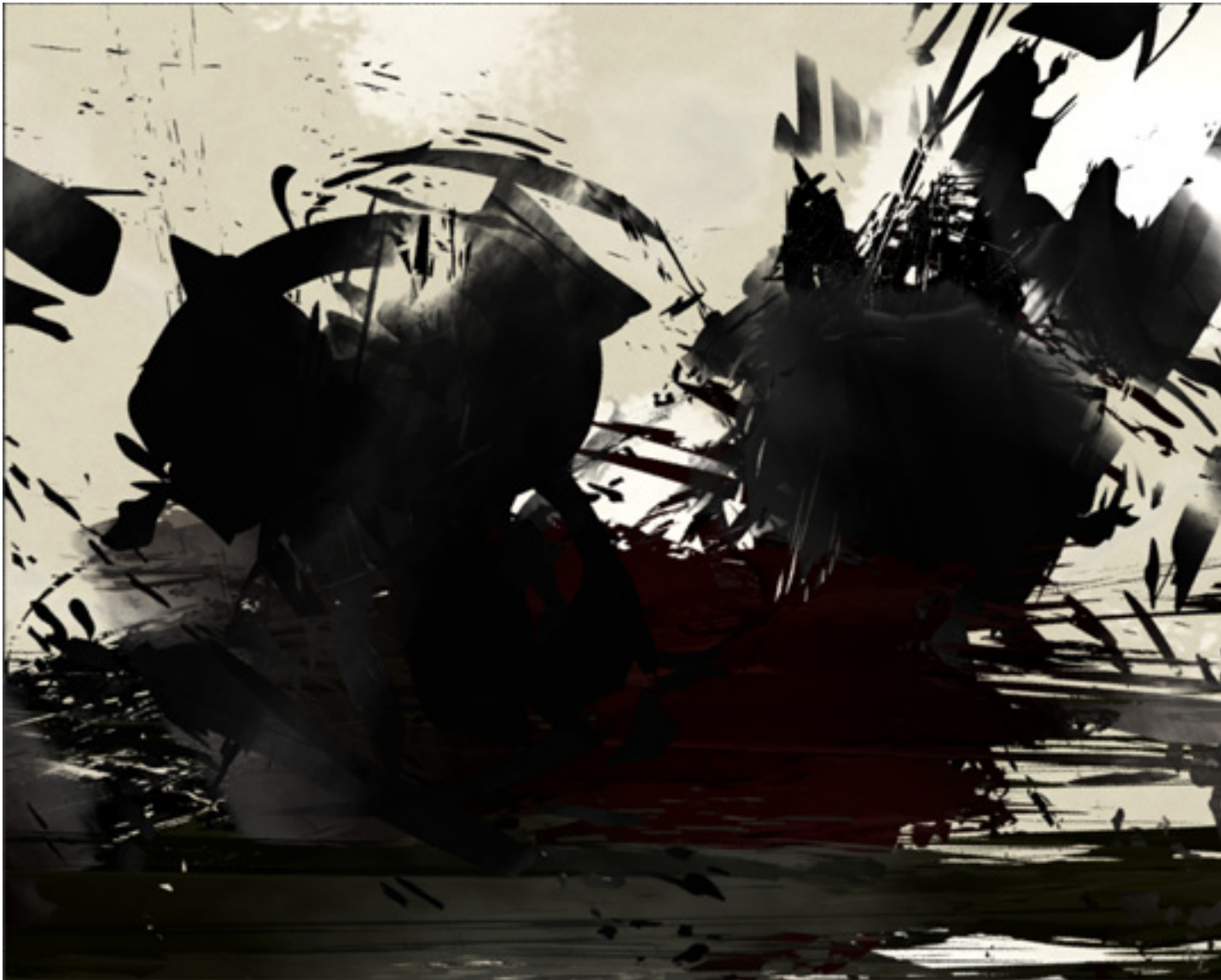
darkmats 250682 2011 Acryl, VOC auf Leinwand 200 x 250 cm